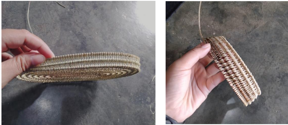
Pembuatan upia karanji gorontalo.

2). Mahasiswa melakukan live streaming sebagai salah satu metode pemasaran produk upia :