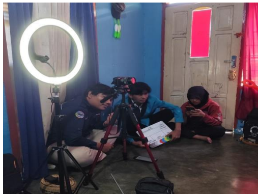
Proses wawancara kepada pemilik UMKM upia karanji.