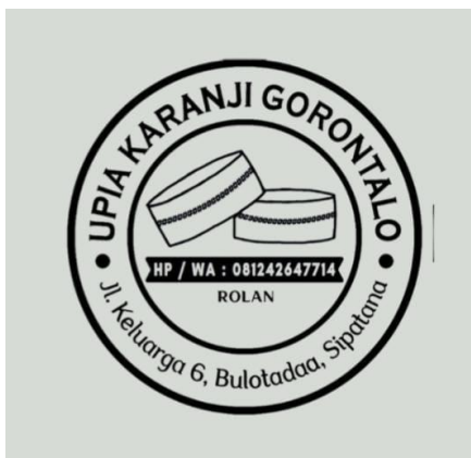
Logo cap stempel upia karanji.

4). Mahasiswa mendesain logo stempel cap upia karanji :