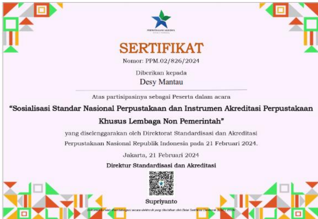
Sertifikat Sosialisasi Nasional Perpustakaan dan Instrumen Akreditasi Perpustakaan Lembaga Non Pemerintah