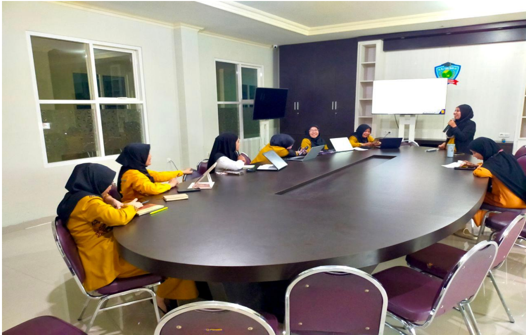
Kegiatan Kelas Persiapan TOEFL ITP (ETS), untuk Sertifikasi Dosen (dalam status SISTER), yang digagas oleh Kantor Urusan Internasional UBM dosen (status SISTER), Senin (17/2/2025), di Ruang Akreditasi, Kampus UBM Gorontalo.