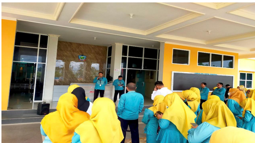
Dokumentasi Kepala BPSDM Pembukaan pengisian BKD dan Pelatihan AA Pekerti serta informasi Pembukaan Beasiswa Bagi dosen yang akan melanjutkan studi lanjut Doktoral, Senin 21 Juli 2025