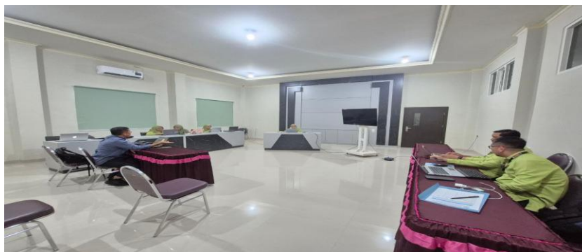
Capacity Upgrading Riset Dosen