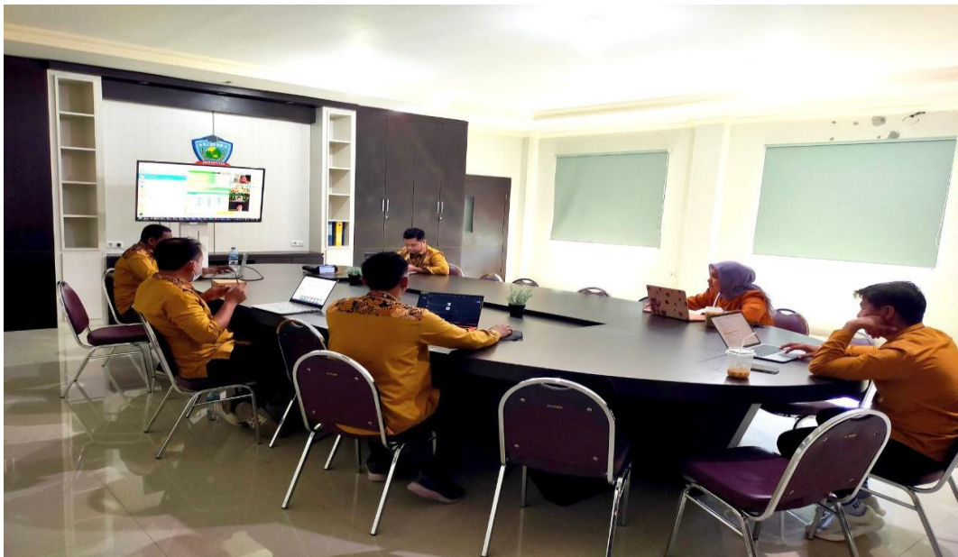
Bimtek Pelaksanaan Audit Mutu Internal Berbasis SIMAZIS, yang diikuti oleh Auditor Mutu, Selasa (22/7/2025)