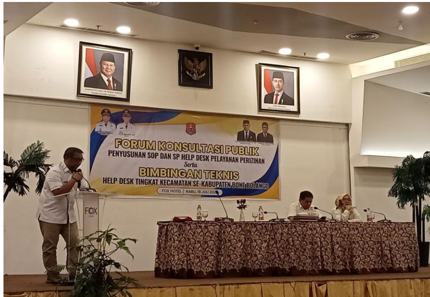
BIMTEK Help Desk Perizinan di Hotel Fox Gorontalo