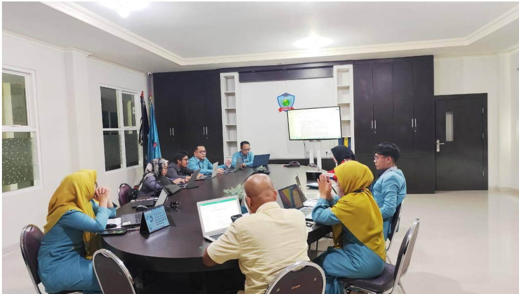
Kegiatan Bimbingan Teknis Pengusulan Jabatan Fungsional di Ruang Akreditasi Kampus UBM Gorontalo, Senin (04/08/2025)