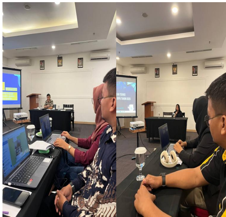
Bimtek BIPA (Bahasa Indonesia Bagi Penutur Asing) Kantor Bahasa Provinsi Gorontalo