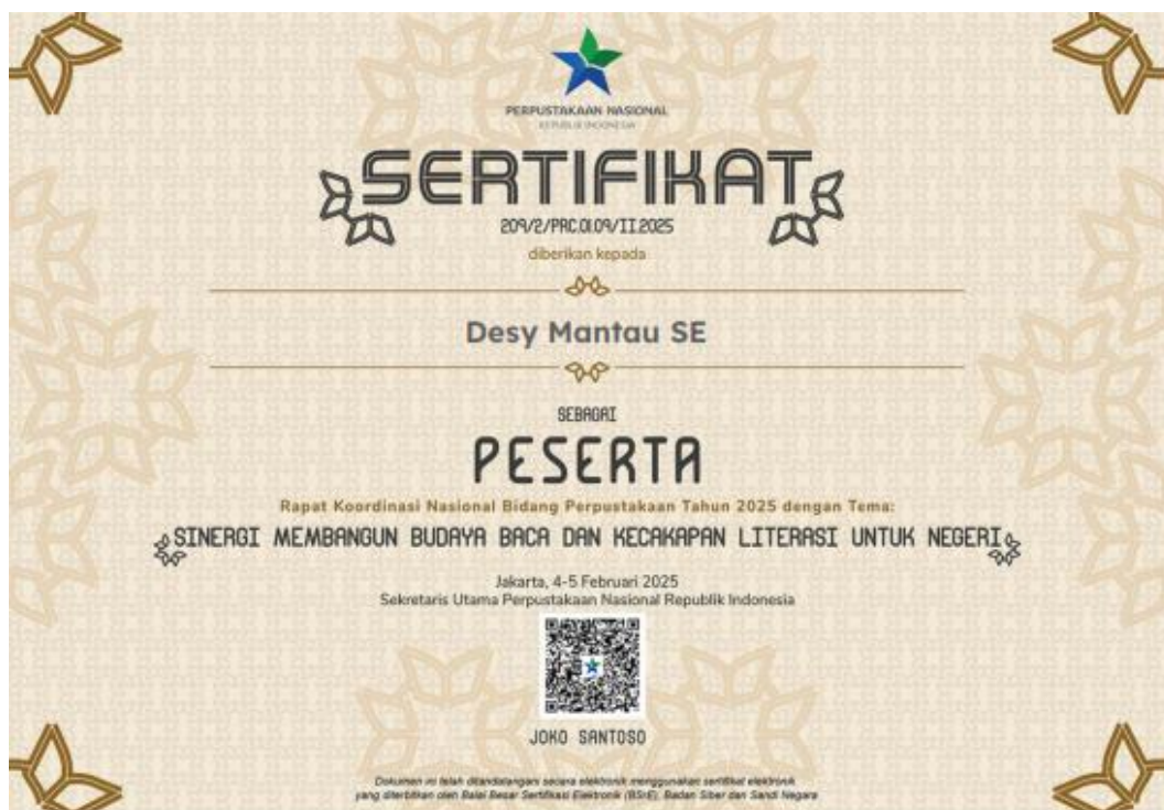
Rapat Koordinasi Nasional Bidang Perpustakaan