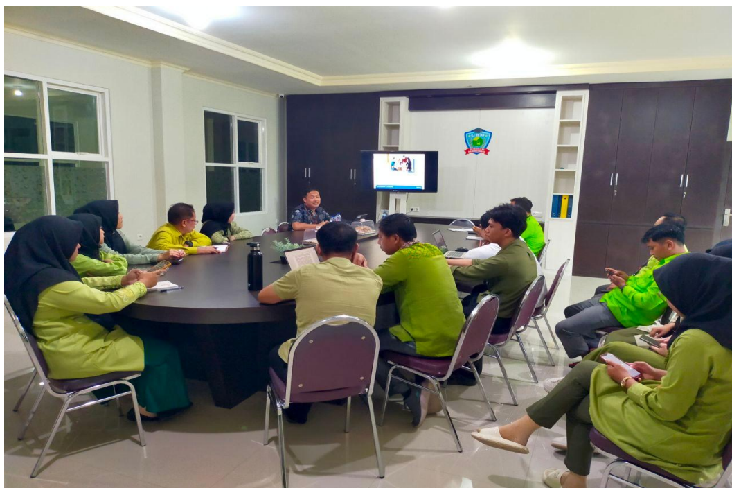
Dokumentasi kegiatan sosialisasi pengembangan Sistem di Pendidikan Tinggi, terkait Sistem Outcome Based Education (OBE) kepada dosen dan tendik Rabu (09/07/2025)